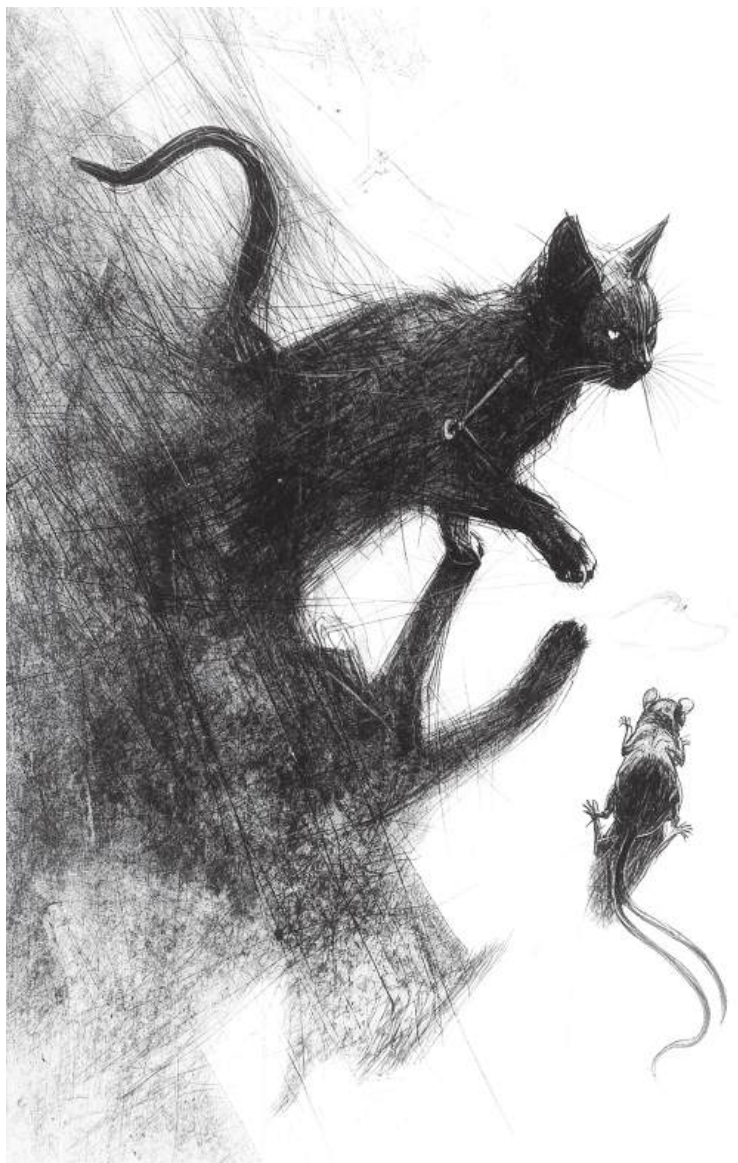
Kot i mysz