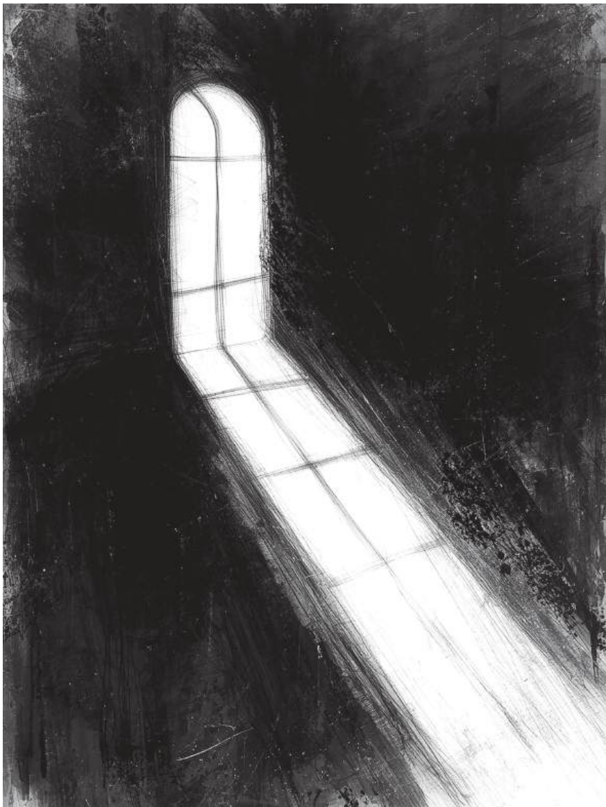
Lux Aeterna Silentium