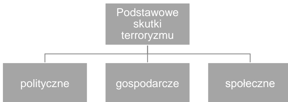
Rysunek nr 1: Podstawowe skutki terroryzmu.

Skutki terroryzmu można podzielić na trzy podstawowe rodzaje, które przedstawia poniższy rysunek.