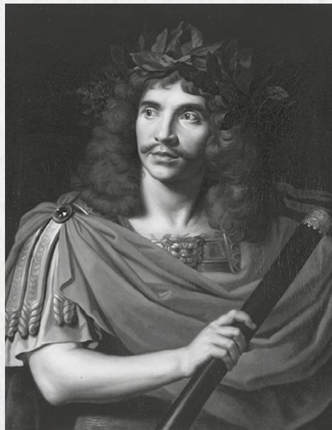
Molier, portret Nicolasa Mignarda, 1658

go do prawdziwego teatru w Hôtel de Bourgnogne. W 1643 r. młody Poquelin, chcąc zrealizować swe aktorskie i dramatopisarskie zainteresowania, powołał do życia Illustre Théâtre (Teatr Znakomity). Do tego pomysłu przywiódło go nie tylko zainteresowanie sztukami dramatycznymi, ale