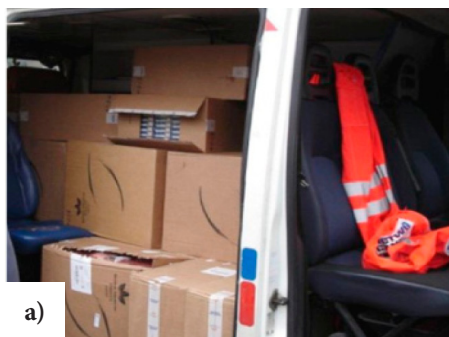
Ryc. 2. Nielegalne papierosy przewożone samochodem z oznaczeniami: a) ambulansu ratowniczego, b) firmy ochroniarskiej, c) instytucji pożytku publicznego