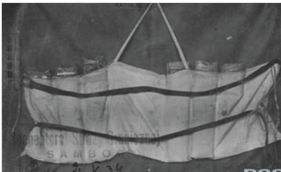
Ryc. 5. Torba służąca do przemytu zakładana pod odzież w latach 1934–1936