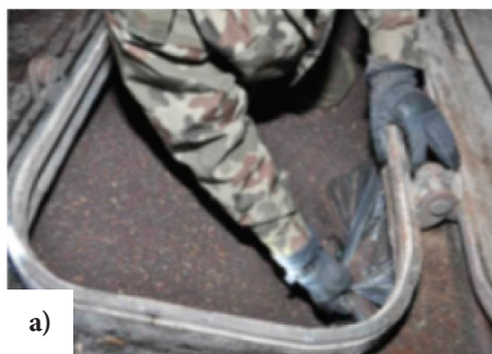
Ryc. 4. Papierosy ukryte w wagonie towarowym w ładunku a) rzepaku, b) soli drogowej

Przypadek: Na przedmieściach Augustowa funkcjonariusze Straży Celnej zatrzymali do kontroli litewskiego tira. Z dokumentów wynikało, że kierowca wiezie z Łotwy na Węgry transport drewnianych zrębków. Okazało się jednak, że ciężarówka jest wypełniona kartonami z papierosami — 640 tys. paczek bez banderoli. W podobnej sytuacji, w zatrzymanej ciężarówce miał być ładunek kartonowych opakowań, transportowanych z Łotwy do Czech.