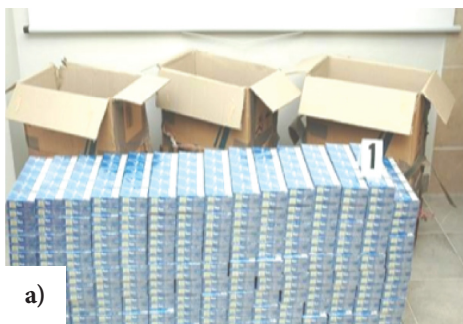
Rys. 3. a) Papierosy przynoszono przez zieloną granicę w oryginalnych kartonowych pudłach, do których przymocowano szelki wykonane z parczanych pasów i gumowej wykładziny; b) Transport pieszy papierosów w torbach podróżnych przez przejście graniczne